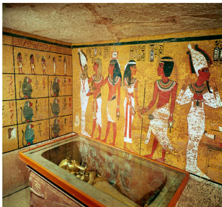
PHOTO DE LA TOMBE